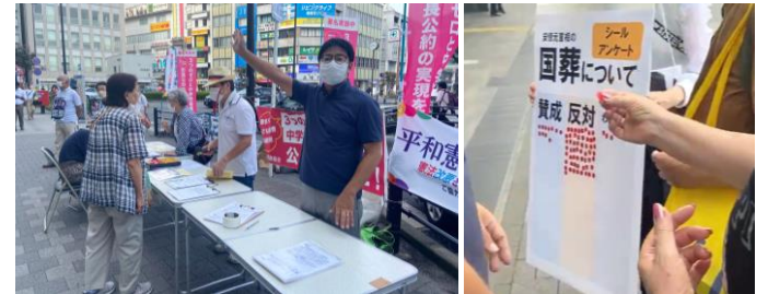
8/26 鶴見駅東口 神奈川3区市民連絡会のみなさんと

いは5月分がまだ支払われていないところもあり、経営が逼迫しています。未だ、自らの身内には大盤振る舞いで国民の暮らしには渋い金払い。こうした傲慢な政治は止めなければならないと思います。